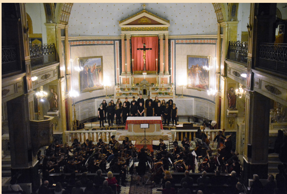
Η αμερικανική χορωδία και ορχήστρα Shaker Heights High School

Τέλος, τη Μ. Δευτέρα , ο ναός μας φιλοξένησε την πατρινή χορωδία Αντηχώ , με το παιδικό και προ-παιδικό της τμή-