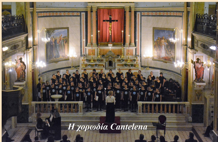
Η χορωδία Cantelena