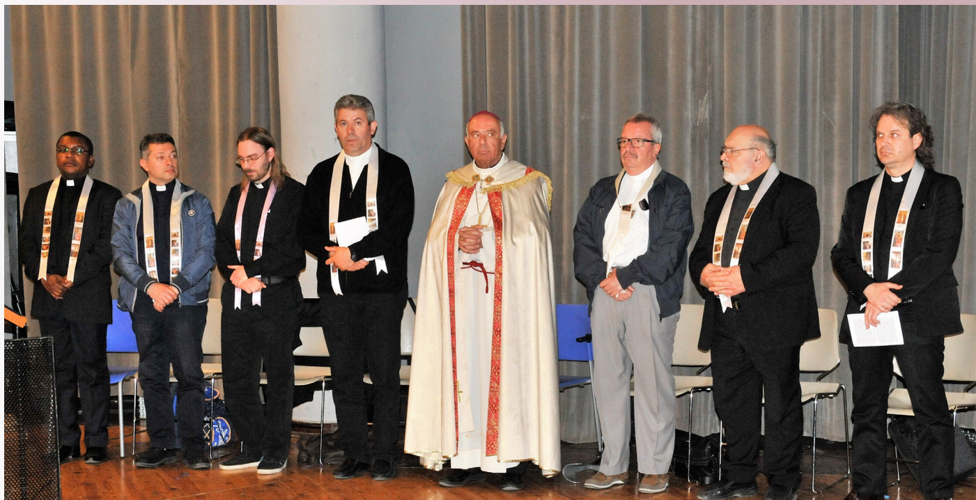
Ο Σεβασμιότατος Αρχιεπίσκοπος π. Σεβαστιανός με τους συμπροσευχόμενους ιερείς κατά την ακολουθία του Λόγου

λόγο βοήθησε τους πιστούς να κατανοήσουν τα βιβλικά αναγνώσματα που είχαν προηγηθεί. Την ακολουθία πλαισίωσε με άσματα η τοπική χορωδία ALLEGRI, η οποία είχε προετοιμαστεί κατάλληλα για την περίπτωση, ενώ επικράτησε απόλυτη τάξη, σεβασμός και κατάνυξη. Το αυθόρμητο χειροκρότημα του κόσμου, μετά την απόλυση, φανέρωσε την ικανοποίησή του.