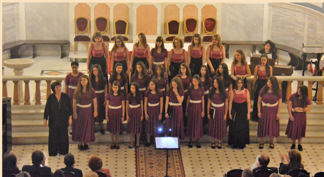
Η χορωδία Αντηχώ

Ευχαριστούμε όλες τις χορωδίες και ευχόμαστε πάντα επιτυχίες!