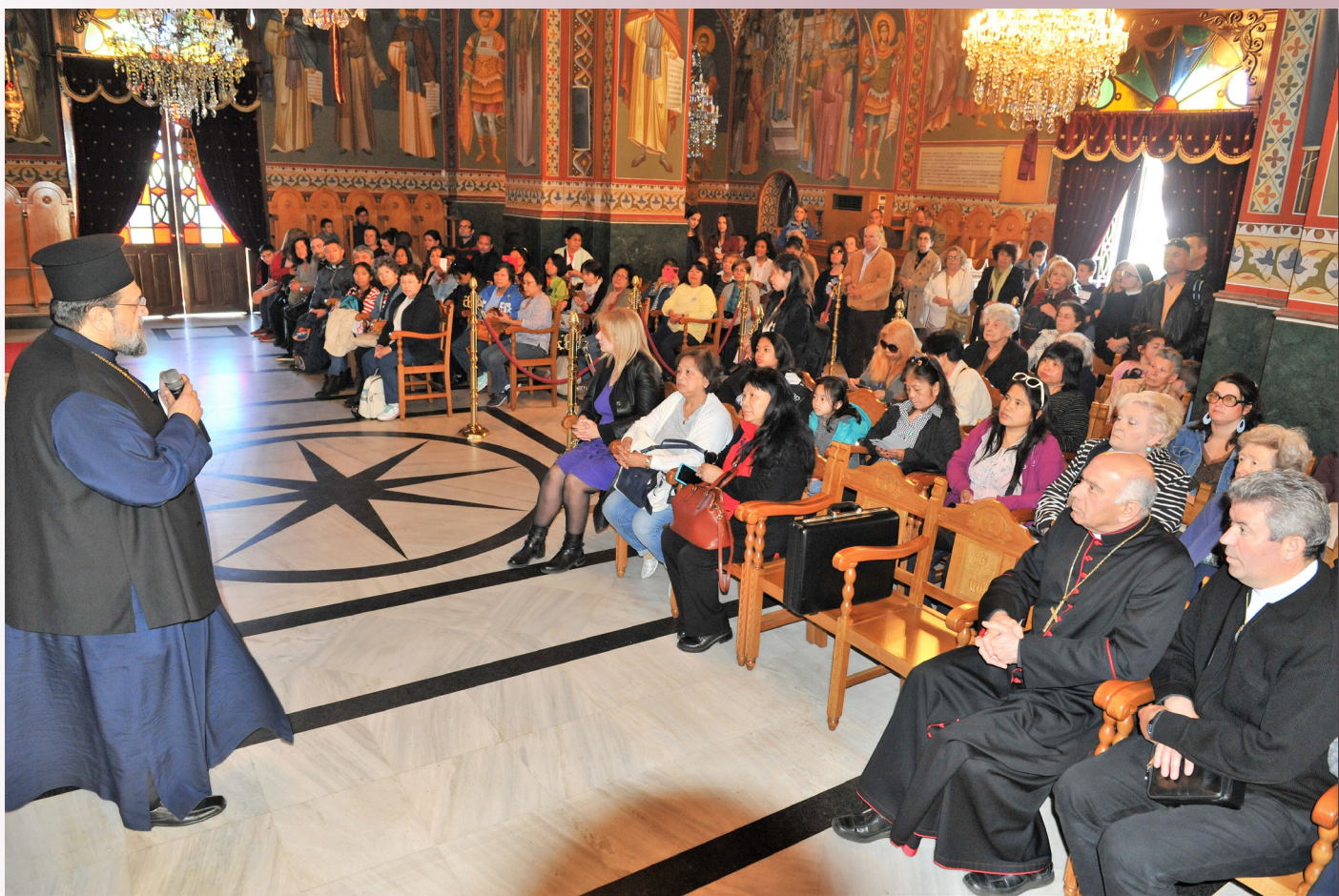
Ο Μητροπολίτης Μεσσηνίας κ. Χρυσόστομος ξεναγεί τους προσκυνητές στον Μητροπολιτικό Ναό της Υπαπαντής

ήσασταν λαός, αλλά τώρα είστε λαός του Θεού. Εσείς, που δεν είχατε ελεηθεί, αλλά τώρα ελεηθήκατε (Α’ Πε. 2, 9-10). Ο ευαγγελικός τρόπος ζωής, που είναι το φως του Χριστού, πρέπει να προέρχεται από την βαθιά πεποίθηση που γεννιέται από τα μυστήρια. Ο Χριστός εμπιστεύεται το φως αυτό στους μαθητές του, προκειμένου να το φέρουν ως την άκρη της γης. Εκείνη η φράση των αγγέλων της Ανάληψης: « Άνδρες Γαλιλαίοι, τι σταθήκατε, κοιτάζοντας στον ουρανό; » (Πρξ. 1, 11), πρέπει να μας επαναφέρει στην πραγματικότητα. Το έργο μας βρίσκεται εδώ στη γη, όχι στα