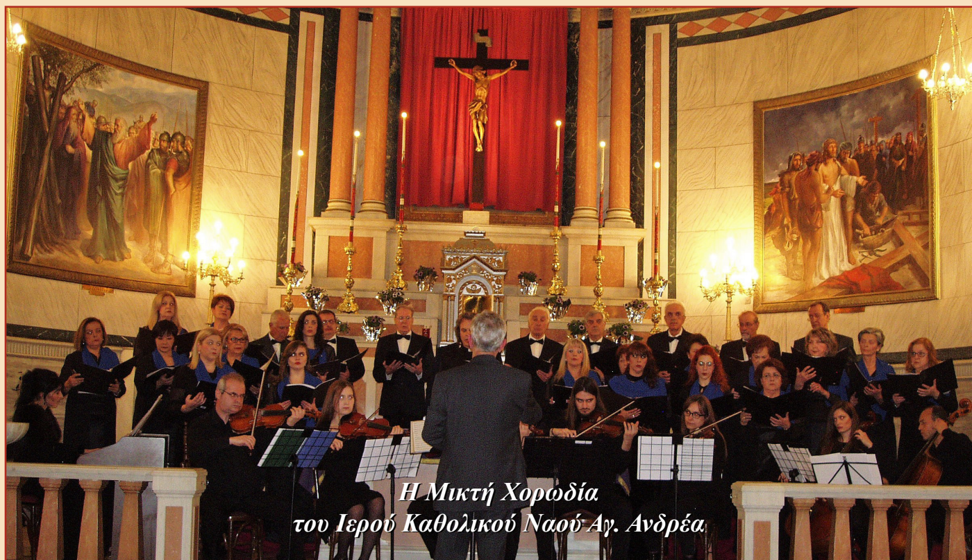
Η Μικτή Χορωδία του Ιερού Καθολικού Ναού Αγ. Ανδρέα.