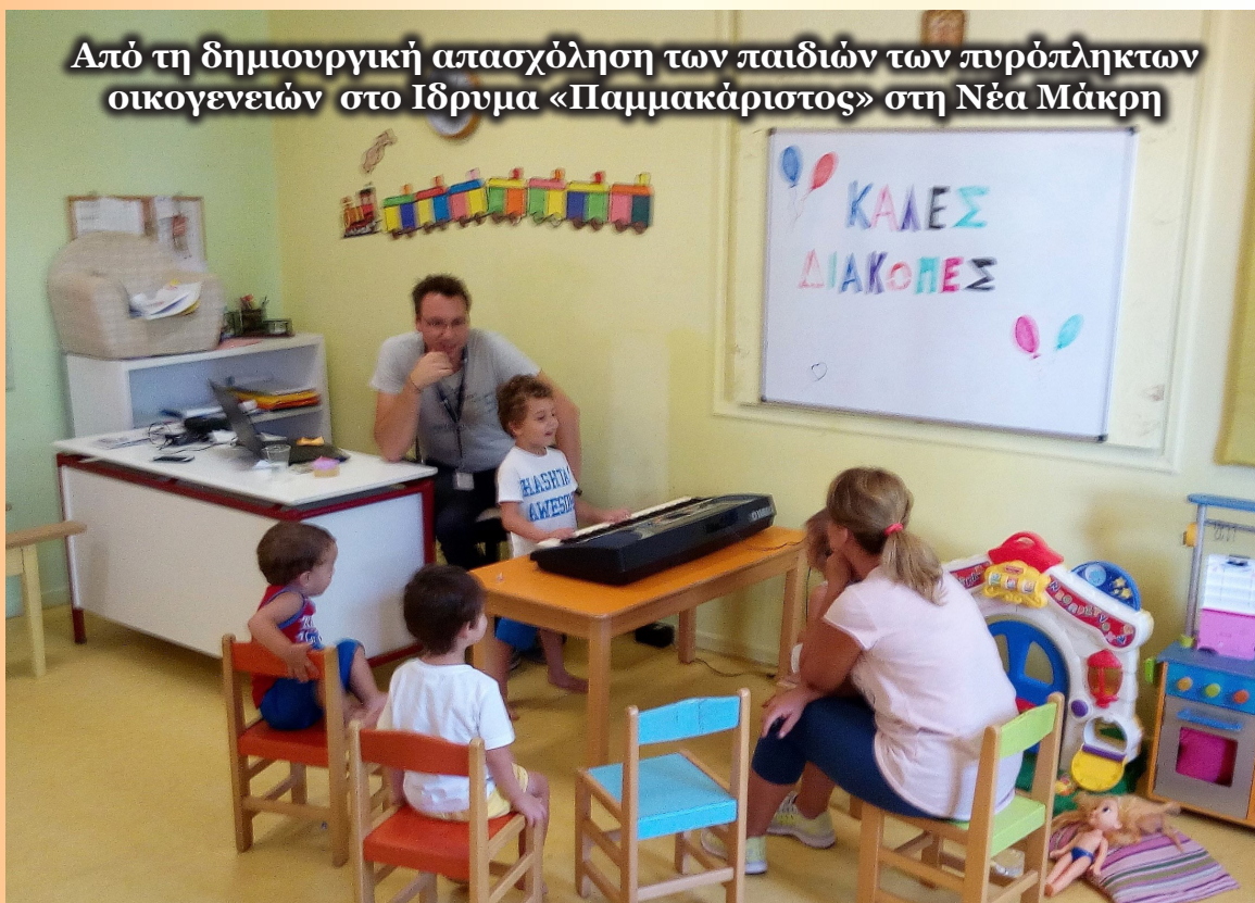
Από τη δημιουργική απασχόληση των παιδιών των πυρόπληκτων οικογενειών στο Ίδρυμα «Παμμακαρίστου» στη Νέα Μάκρη

σει πώς μπορεί να ανταποκριθεί καλύτερα σε αυτές, πάντα με στόχο την ανακούφιση των πυροπαθών.