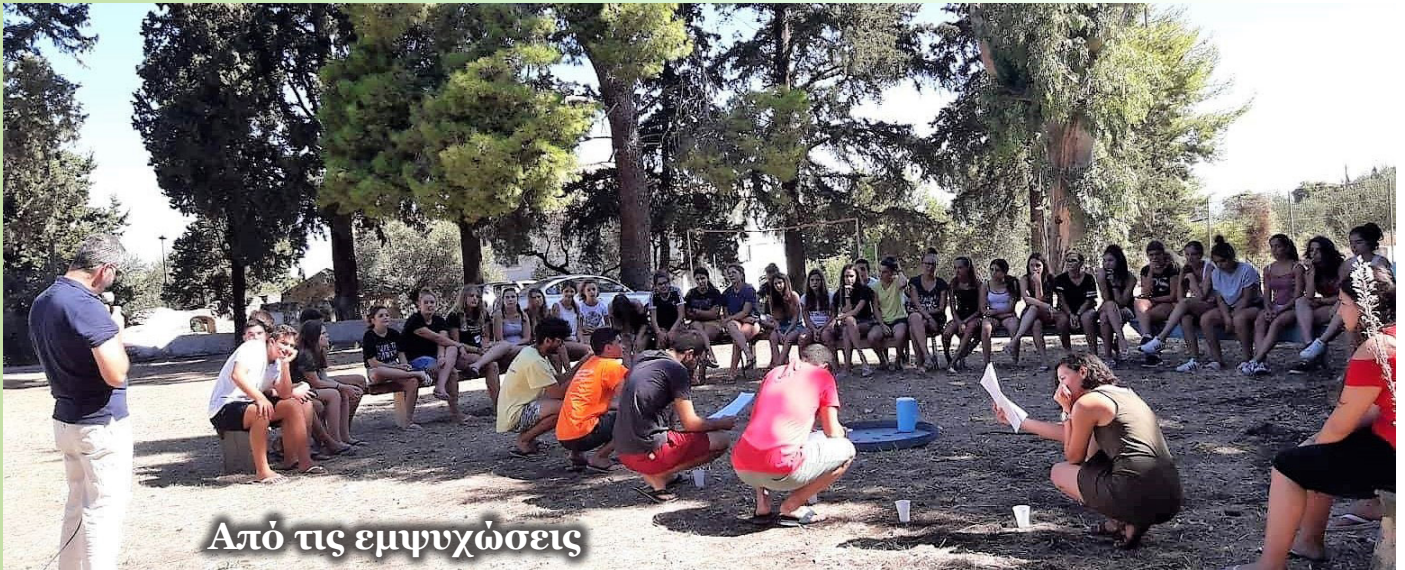
Από τις εμπυρώσεις

Όλα ξεκίνησαν τα ξημερώματα της Τετάρτης, 8 Αυγούστου , όταν έφηβοι, νέοι, φοιτητές και εμπυρωτές από την ΕΚΝΕ Σύρου συγκεντρωθήκαμε στο λιμάνι της Ερμούπολης με προορισμό το στολίδι του Ιονίου: τη Ζάκυνθο . Σκοπός μας; Συνταξιδιώτες όλοι μαζί να καταφέρουμε να μαζέψουμε όσες πιο πολλές εμπειρίες μπορούμε. Σε λιγότερο από μισή μέρα, λοιπόν, το νησί αχνοφαινόταν από την Πελοπόννησο και, καθώς πλησιάζαμε, ξέραμε ότι θα ζήσουμε κάτι το μοναδικό. Με το που κατεβήκαμε από το πλοίο, τα πρώτα μας σχόλια αφορούσαν τα καταπράσινα τοπία και τους μαγευτικούς λόφους. Φθάνοντας στο κατάλυ-