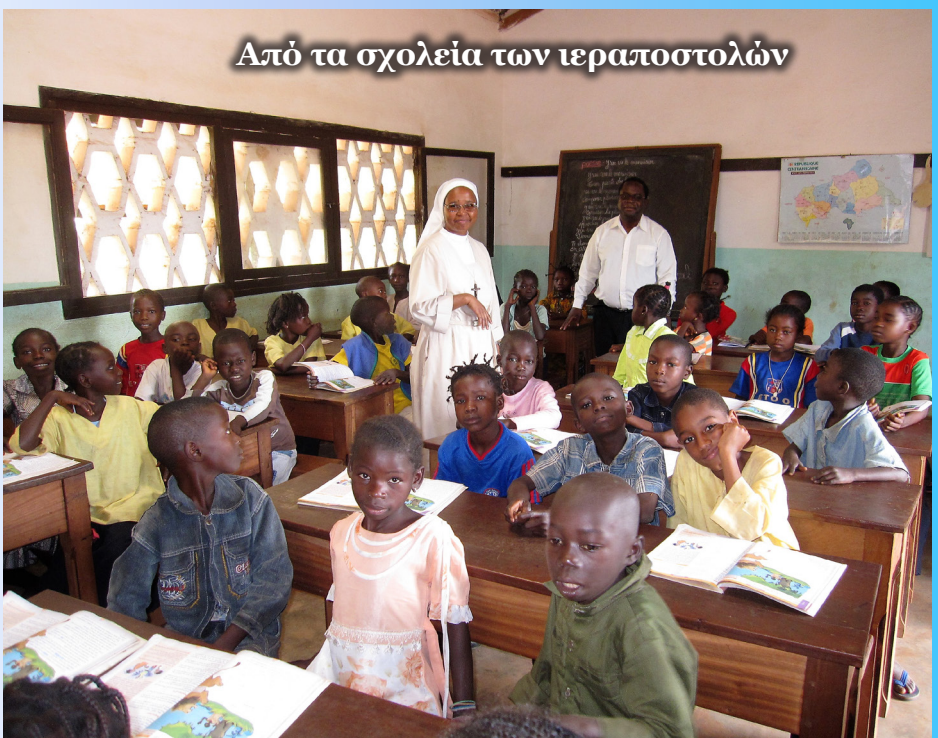
Από τα σχολεία των ιεραποστολών

για να φροντίσει τα παιδιά του δρόμου και να τα πάει σε έναν ξενώνα διαμονής, όπου κάνουν αποτοξίνωση από τη βενζίνη (διότι τα υποχρεώνουν να βγάζουν φωτιές από το στόμα στους δρόμους για λίγο χαρτζιλίκι), ούτε είναι είδηση το ότι διδάσκει γράμματα σε χιλιάδες αναλφάβητους φυλακισμένους. Άλλοι ιερείς, όπως ο π. Stefano, έχουν ξενώνες για τη φιλοξενία παιδιών που έχουν ξυλο-