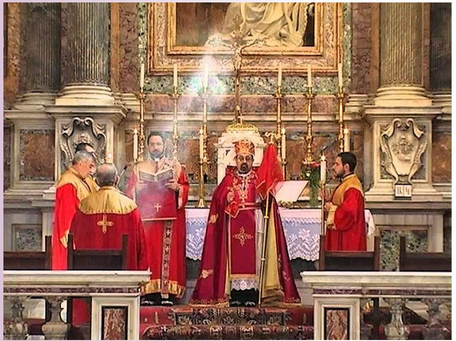
Θεία λειτουργία τυπικού Αρμενίων

Η λέξη « τυπικό » χρησιμοποιείται μερικές φορές σε αναφορά μόνο προς την θεία λειτουργία , αγνοώντας τα θεολογικά, τα πνευματικά και τα πειθαρχικά στοιχεία της πολιτιστικής κληρονομιάς των Εκκλησιών. Με αυτή την έννοια « λειτουργικό τυπικό » έχει οριστεί ως το σύνολο των (λειτουργικών) ιεροπραξιών της κάθε Εκκλησίας ή ομάδας Εκκλησιών. Μεταξύ των « τυπικών », με αυτή την αποκλειστικά λειτουργική έννοια, και των αυτόνομων Εκκλησιών δεν υπάρχει αυστηρή αντιστοιχία. Οι δεκατέσσερις