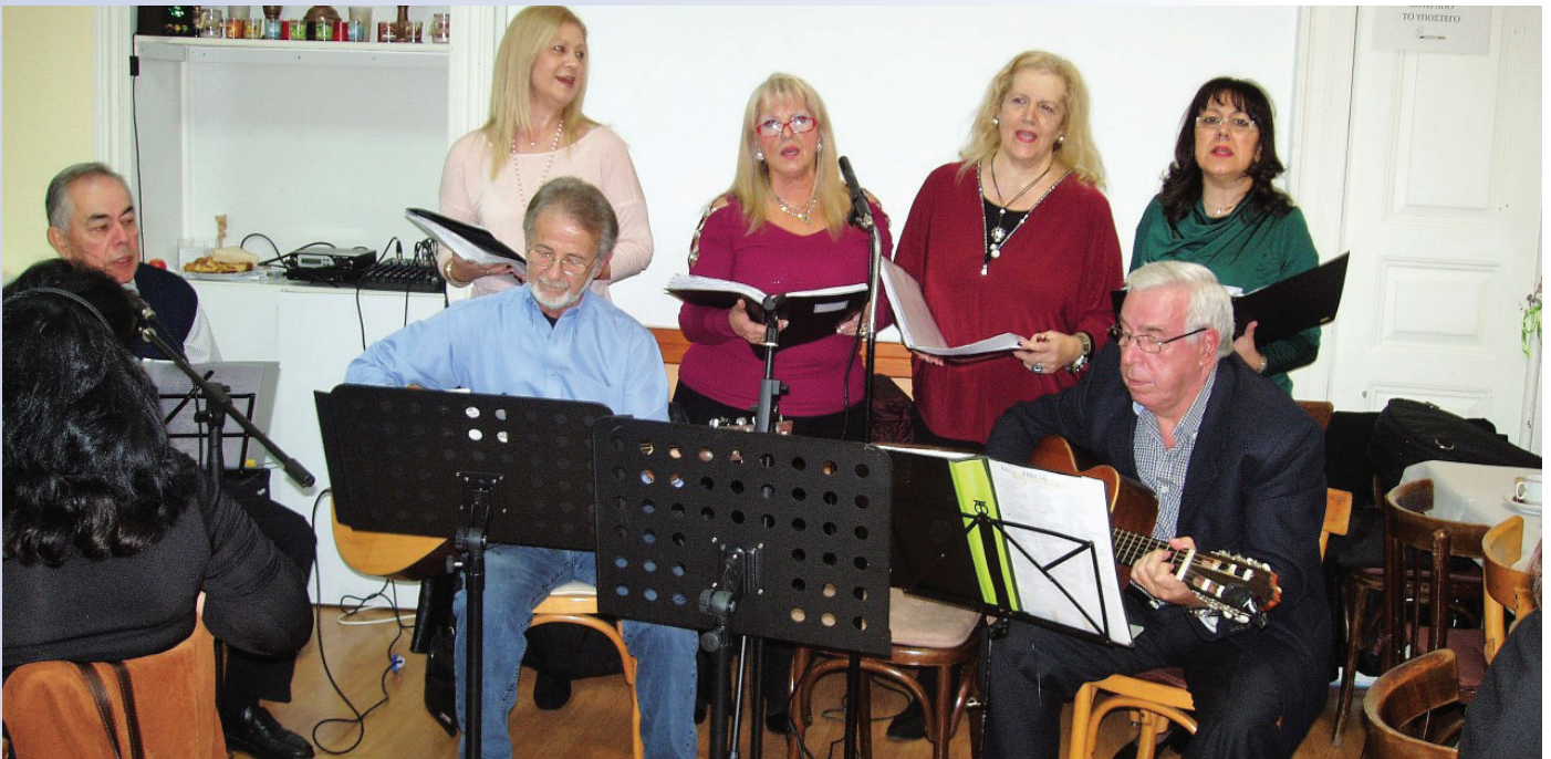
Το «Canto di Patrasso» εν δράσει

Ευχαριστούμε όλους τους συντελεστές αυτών των εκδηλώσεων και ευχόμαστε: πάντα τέτοια!