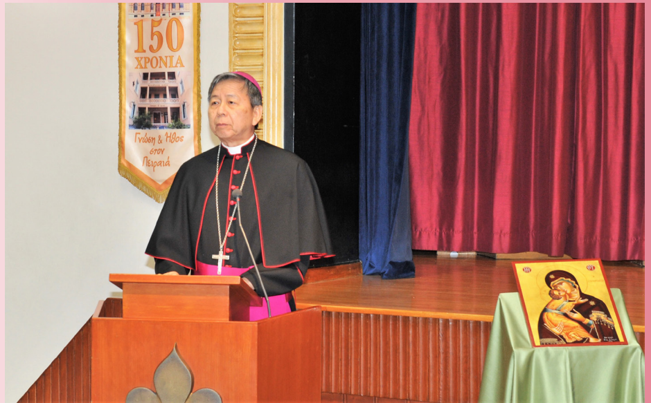
Ο Αποστολικός Νούντσιος στην Ελλάδα, Αρχιεπίσκοπος Savio Hon Tai-Fai, χαιρετίζει τις εργασίες της Συνόδου

Ας δούμε το σκοπό της Σύναξης. Το ποίμνιο της Καθολικής Εκκλησίας στην Ελλάδα έχει αλλάξει σημαντικά κατά τις τελευταίες δεκαετίες. Ενώ μέχρι και τη δεκαετία του 1970 αποτελείτο κυρίως από Έλληνες, από την επόμενη δεκαετία και μετά τα αλληπάλληλα μεταναστευτικά κύματα εμπλούτισαν τις Καθολικές επαρχίες της χώρας μας με πιστούς διαφόρων εθνικοτήτων και γλωσσών: Πολωνοί και Αλβανοί από την Ευρώπη, Νιγηριανοί και Κογκολέζοι από την Αφρική, Φιλιππ-