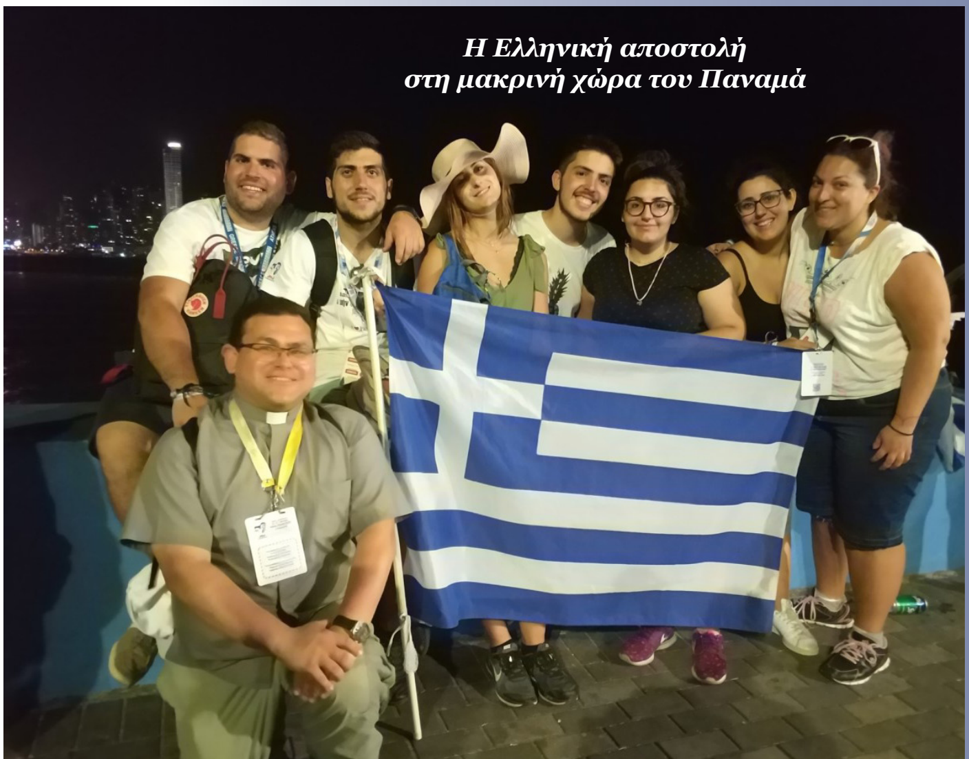
Η Ελληνική αποστολή στη μακρινή χώρα του Παναμά