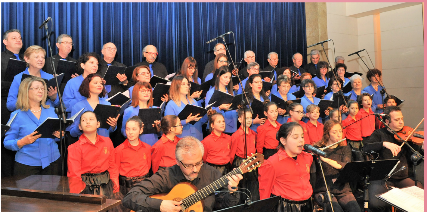
Η χορωδία του Ι. Ν. Ευαγγελίστριας Ερμούπολης Σύρου

Η δεύτερη εισήγηση έγινε από τον γράφοντα και είχε θέμα «Ο Νέος Ευαγγελι-σμός με οδηγό την Αποστο-λική Παραίνεση “Η χαρά του Ευαγγελίου”». Ο βα-