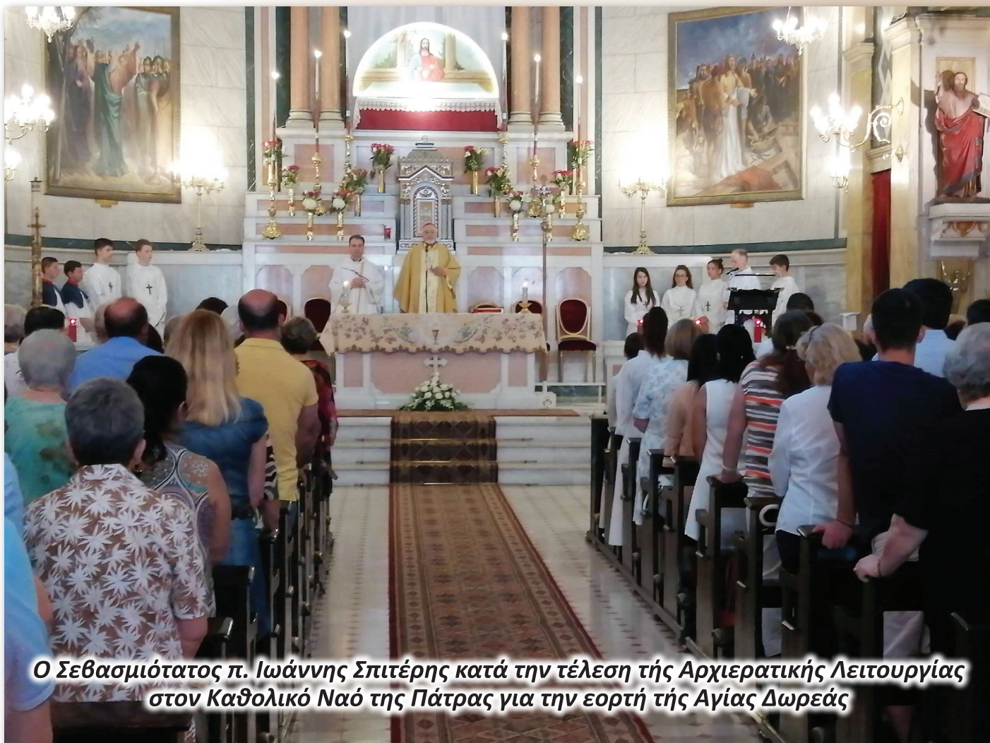
Ο Σεβασμιότατος π. Ιωάννης Σπιτέρης κατά την τέλεση της Αρχιερατικής Λειτουργίας στον Καθολικό Ναό της Πάτρας για την εορτή της Αγίας Δωρεάς

Για τους Πατέρες της Εκκλησίας , η μυστηριακή κοινωνία στο Σώμα και στο Αίμα του ενδόξου Χριστού γίνεται το θεμέλιο της οργανικής ενότητας του Σώματος του Χριστού, δηλαδή της