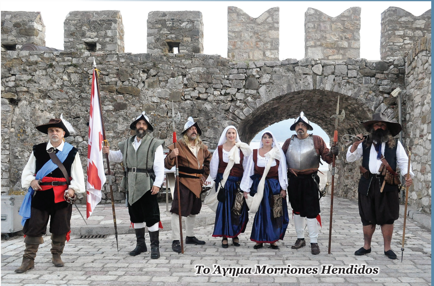
Το Άγημα Morriones Hendidos

την μελέτη της ιστορίας βελτιώνουν τις γνώσεις και την παρουσία τους, υλικά, πρακτικά και πνευματικά.