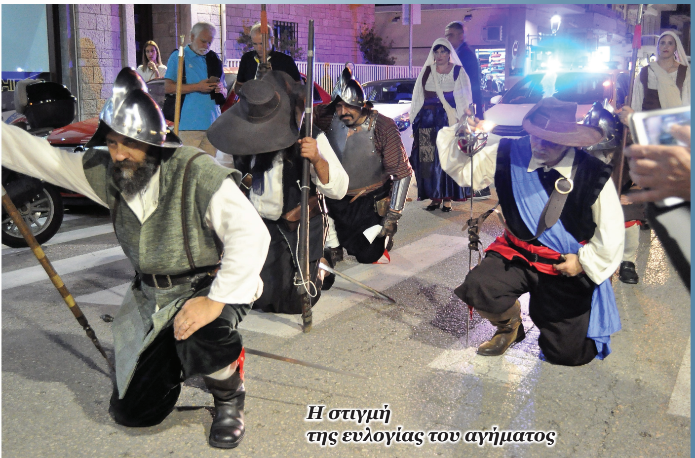
Η στιγμή της ευλογίας του αγήματος

κεφάλι, για να προστατεύονται από τον ήλιο και τις σπαθιές. Είχαν για σπαθί το ραπιέρ (διαφόρων τύπων, όπως colada, tizona, cazoleta, peppenheimer , κ.α.), δηλαδή ένα μακρύ μυτερό σπαθί (105-120 εκ.) χωρίς μεγάλη κόψη, καθώς σκοπός του ήταν να εισχωρεί ευθεία σαν βελόνα στα κενά από τις πανοπλίες ή σε ζωτικά όργανα, ενώ τα κυρτά οθωμανικά σπαθιά ήταν πιο κοντά (75 εκ περίπου) και σκοπό είχαν να κόψουν σαν ξυράφι ή σαν τσεκούρι. Όλοι στις γάμπες τους είχαν κόκκινη κυρίως κορδέλα αλλά και σήμα ραμμένο στο μπράτσο τους ( σημαία των τέρσιος ), για να ξεχωρίζουν στον ορυμαγδό της μάχης, αφού πολλοί ήσαν μισθοφόροι και ομοεθνείς – οι οποίοι συχνά ήταν αντίπαλοι! Με ανάλογες προσαρμογές το tercio πολεμούσε τόσο σε στεριά όσο και σε θάλασσα. Αποτελείται από τους πικέρος ( σαρισσοφόρους ), που είχαν ένα δόρυ μήκους 6 μέτρων περίπου, το οποίο παρέτασσαν μπροστά τους, σχηματίζοντας φράγμα για το αντίπαλο ιππικό που