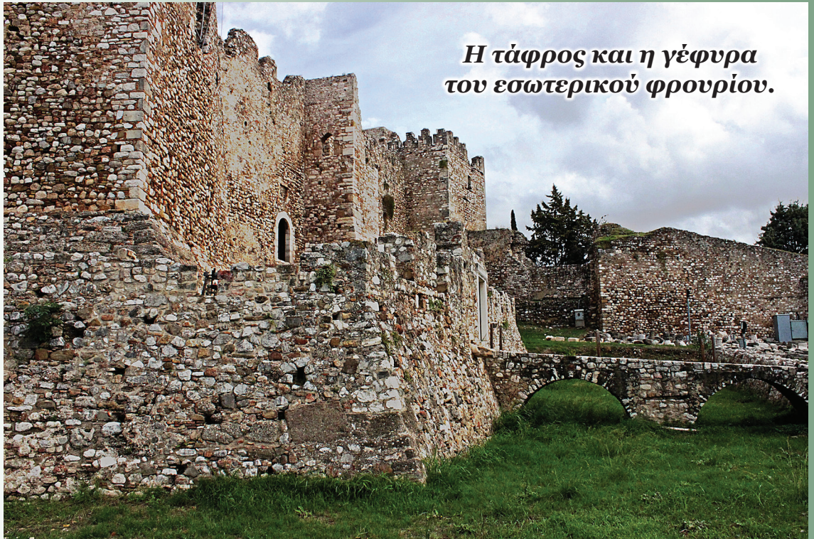
Η τάφος και η γέφυρα του εσωτερικού φρουρίου.

το εκάπαν τότε οι Ρωμαίοι εις το ταξείδι εκείνο [...]