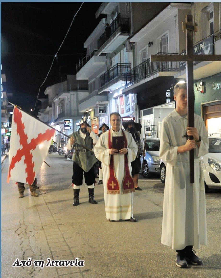
Από τη λιτανεία

και οσίων. Σαφώς και πολέμησαν και πλήθος ελλαδικών πολεμιστών , ντόπιες ενισχύσεις κυρίως από Ζάκυνθο, αλλά στον κύριο όγκο τους ως μισθοφόροι ( stradioti ) - και αυτοί χριστιανοί (στην πλειοψηφία τους ορθόδοξοι ), που είχαν επίσης εκείνη την ημέρα την παρουσία και την ευλογία του ορθόδοξου ιερέα, ο οποίος μάλιστα τους μοίρασε μολυβένιους σταυρούς• ο δε καθολικός διένειμε ροζάρια στους υπόλοιπους. Όμως η πλειοψηφία του στρατεύματος ήταν καθολικοί και αυτό έπρεπε να φανεί απτά, αφού μάλιστα παρουσιάζουμε ένα ισπανικό tercio . Το tercio είναι η βασική στρατιωτική μονάδα των Ισπανών της εποχής από το 1550 ως το 1720 περίπου.