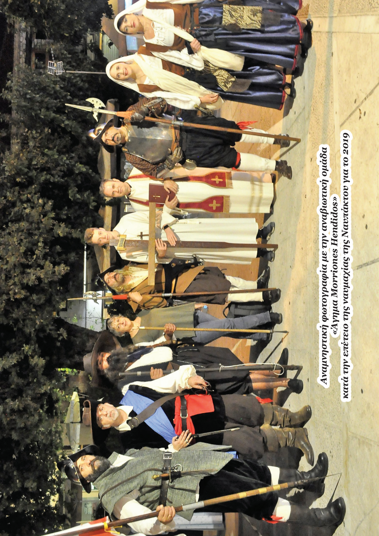
Αναμνηστική φωτογραφία με την αναβιωτική ομάδα «Άγημα Μορριόνες Hendidos» κατά την επέτειο της ναυμαχίας της Ναυπιάκτου για το 2019