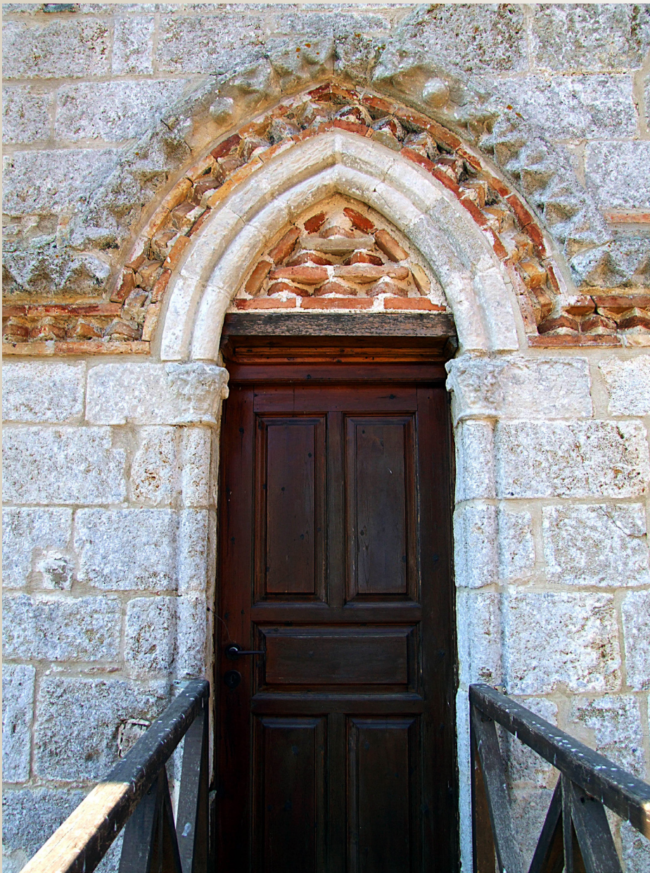
Η θαυμάσιας ομορφιάς γοτθική θύρα του επάνω ορόφου του ναού.

ήταν να ειπώ «ήταν έως σχετικά πρόσφατα» εις τον αδειανό και μισοκατεστραμμένο σήμερα τάφο της Παναγιάς της Βλαχερνίτισσας παρά την Κυλλήνη;