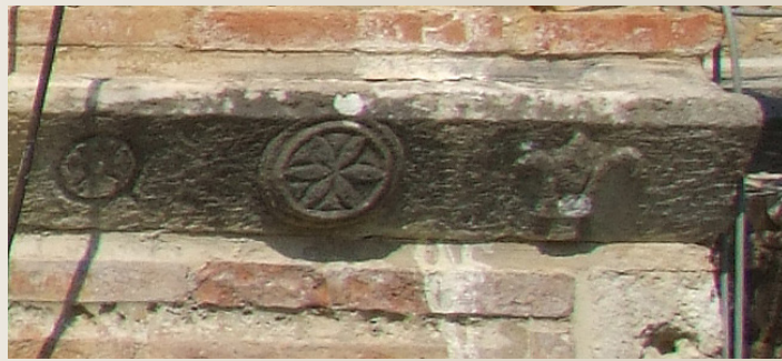
Το φραγκικό κρίνο (fleur de lys) στα δεξιά. Κατά τον μεσαίωνα, κοσμούσε πολλούς θυρεούς Φράγκων ευγενών.

ο Γουλιέλμος Β΄ Βιλλεαρδουίνος, πάντρεψε στα 1271 την πρωτότοκη θυγατέρα του Ισαβέλλα με τον γιό του Καρόλου των Ανζού, του αδελφού δηλαδή του Αγίου Λουδοβίκου, τον Φίλιππο του Τάραντα. Όταν ο σύζυγος της Ισαβέλλας ωστόσο Φίλιππος απεβίωσε εις τα 1277 και με τον χαμό του Γουλιέλμου Β΄ των Βιλλεαρντουέν στα 1278, ο τίτλος του πρίγκιπα της Αχαΐας πέρασε στον Κάρολο Α΄ των Ανζού.